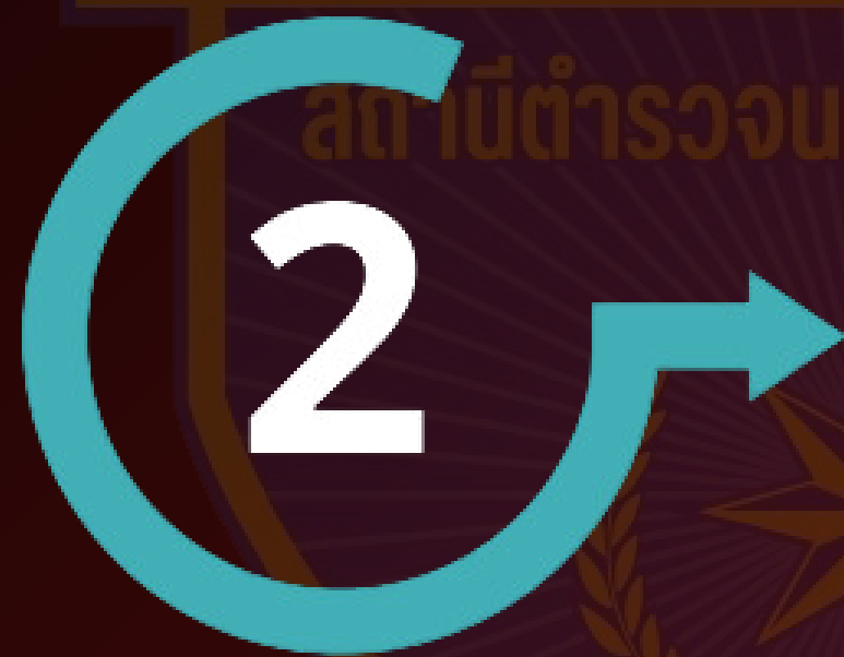
ตรวจสอบเอกสาร