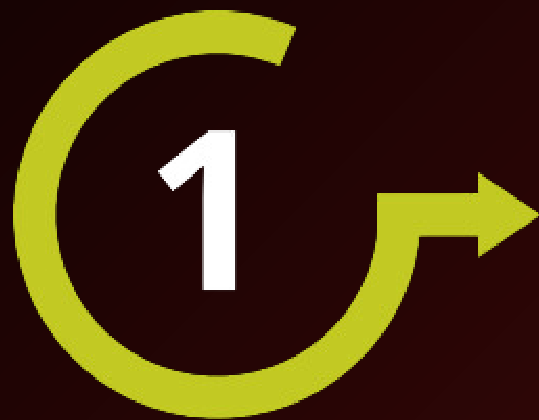
พบเจ้าหน้าที่