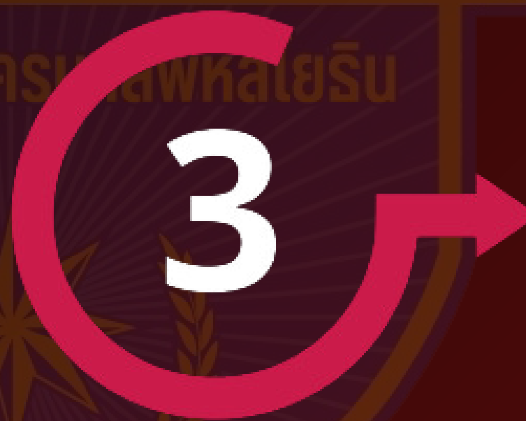
เสนอผู้มีอำนาจ