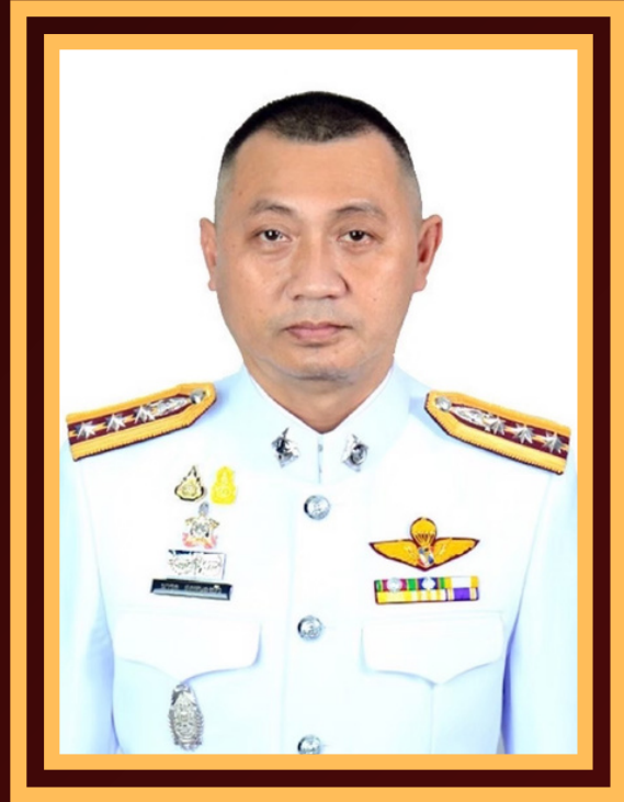
พ.ต.อ.มารุต สุธหนองบัว ผกก.สน.พหลโยธิน