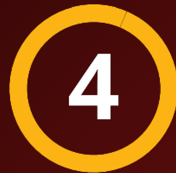
อนุมัติ/ไม่อนุมัติ